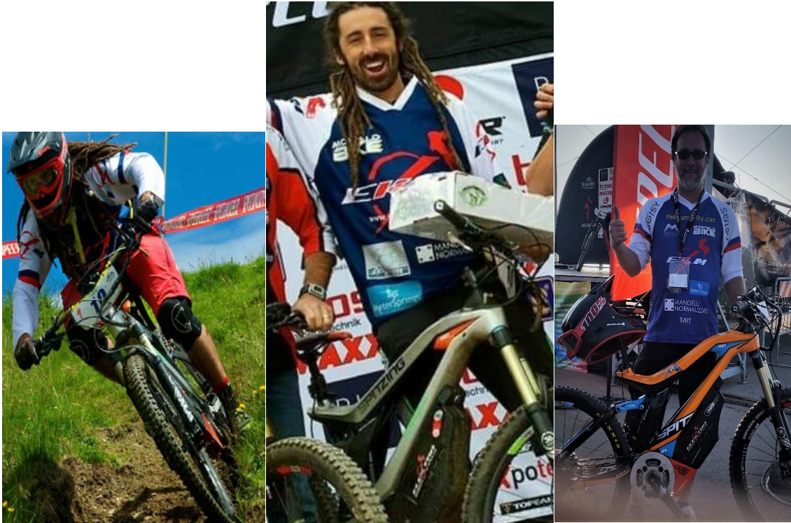
Foto che riportano bellissimi momenti vissuti durante il primo campionato enduro elettrico.